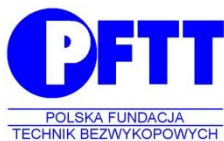
POLSKA FUNDACJA TECHNIK BEZWYKOPOWYCH